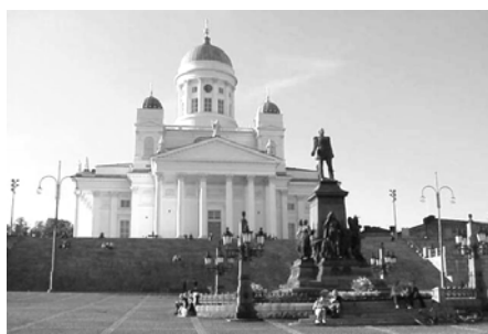
Helsinki, Senatsplatz und Dom

Stadtrundfahrt mit Bus und Boot. Besichtigung der berühmten Felsenkirche, des Doms und des Sibelius-Monuments. Flohmarkt Hietalahti, Bummel über den Marktplatz